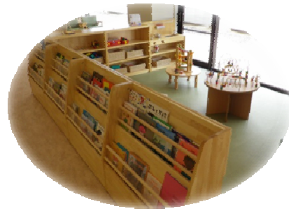
小児科外来プレイルーム