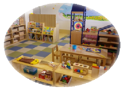
小児病棟わくわくルーム