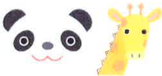
ぱんだぐみ・きりんぐみ

ほしのご保育園より異動してきました。 子ども達一人ひとりと大切に関わっていきたいと思います ので、よろしくお願いします。