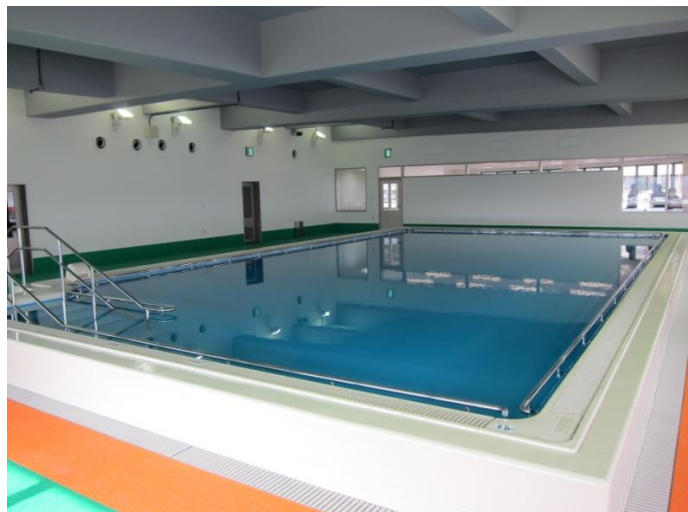
かがやき健康館に設置したプール