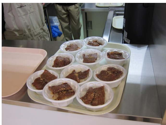
「もうもう亭」さんにご協力いただき小井ぶりを召し上がっていただきました