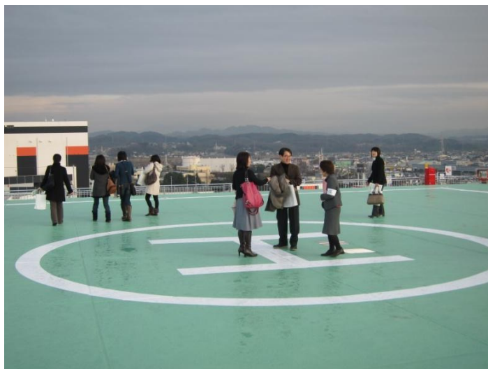
ドクターヘリ・防災ヘリを受け入れるヘリポート