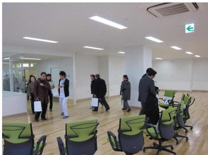
リハビリテーションセンター