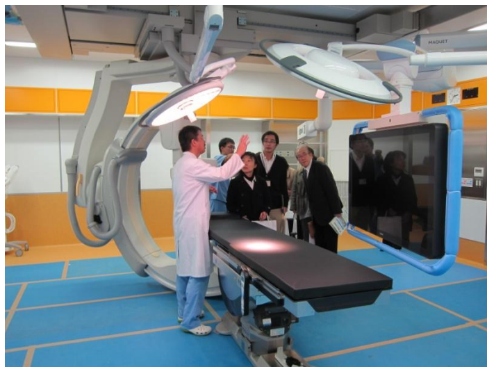
県内初導入のハイブリッド手術室