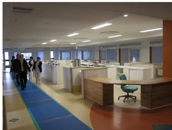
新たに設置する緩和ケア病棟