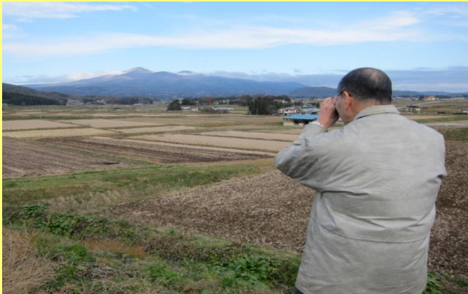
安達太良撮影開始① 安達郡大玉村

新病院エントランスホールへ展示されます 福島県を代表する『安達太良山』の絵画を描いていただくことになりました