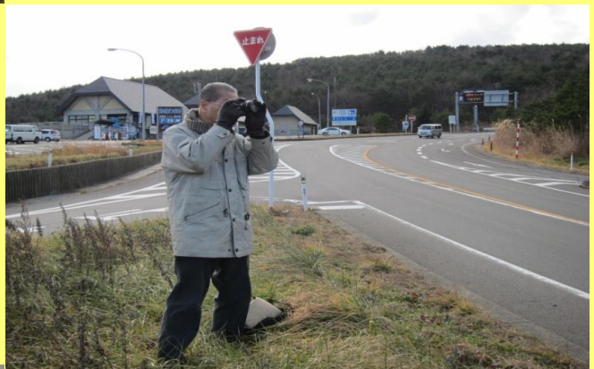
安達太良撮影開始② 福島市『道の駅土湯』