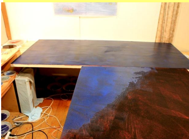
～天然群青重ね塗り～