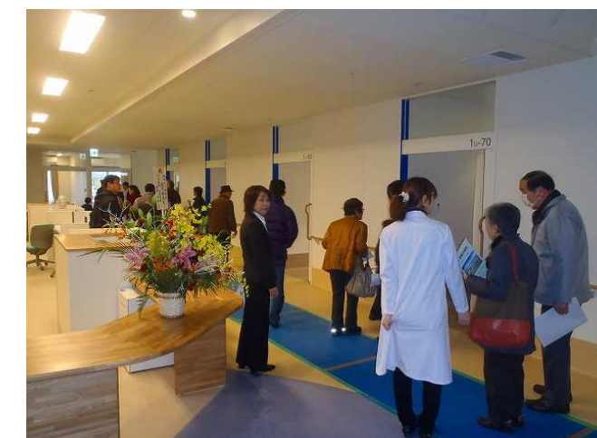
内覧会(病棟: 1階病室)