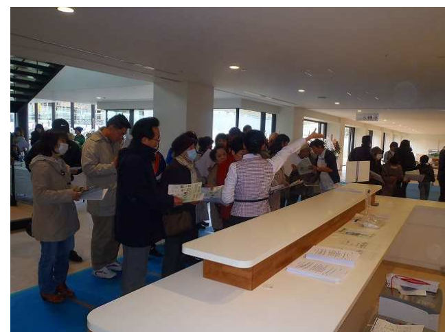
内覧会(外来棟: 外来受付)