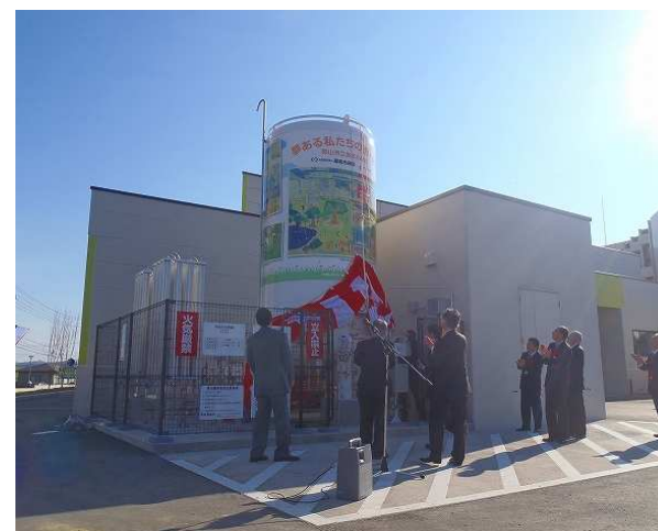
赤木小学校によるタンクペイント除幕