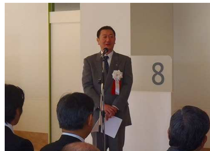
星理事長様によるご挨拶