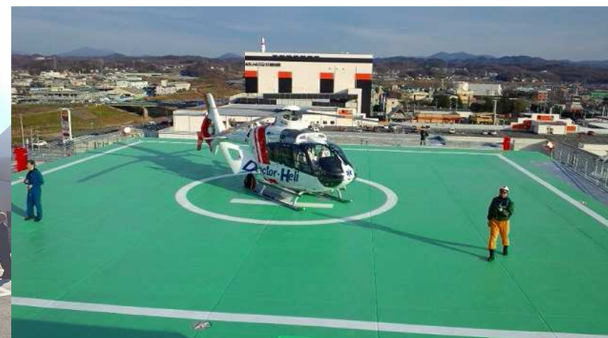
ドクターヘリ着陸の様子